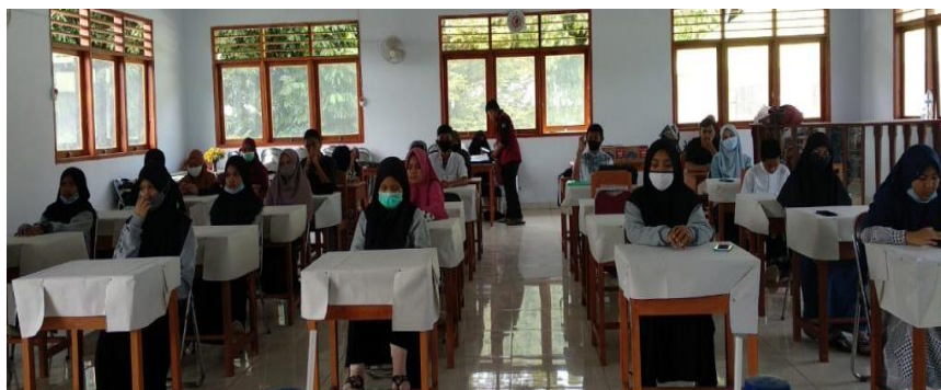
Gambar 3. Hari kedua pelaksanaan pelatihan kaligrafi

Pada pertemuan kedua, penulis melanjutkan materi pelatihan dengan mengajarkan menulis huruf-huruf arab ( hijiyah ) dengan menyambung satu huruf dengan huruf lainnya. Kemudian para santri dilatih menulis kata dan kalimat. Metode belajarnya tetap sama dari sebelumnya yaitu mengikuti atau mencontohkan tulisan yang penulis paparkan. Kegiatan ini dilakukan pada tanggal 24 Maret 2021.