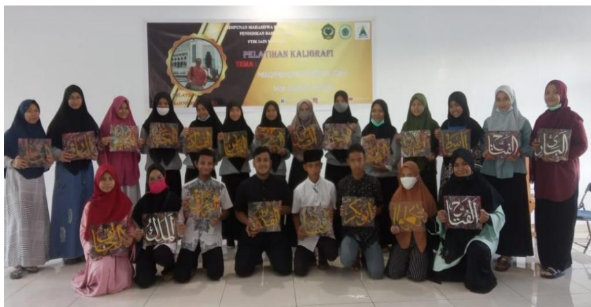
Gambar 4. Hasil Karya Santri Kaligrafi yang sudah di beri ornamen

kaligrafi secara bebas, sesuai dengan kreativitas dari masing-masing santri. Pada tahap ini, terlebih dahulu dilakukan pewarnaan pada lafadz asmaul husna saja, kemudian penulis mengaduk berbagai macam warna kemudian menuangkan sebagai lapisan latar belakang kaligrafi yang sudah ditulis. Selanjutnya penulis menunjukkan pembentukan pola dengan cara mengaduk secara beraturan. Kegiatan pelatihan pada tahap ini dilaksanakan pada tanggal 25 Maret 2021.