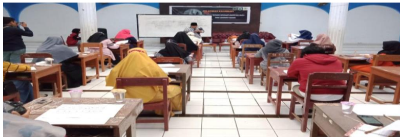
Gambar 2. Kegiatan hari pertama pelatihan kaligrafi

Kegiatan pengabdian yang penulis laksanakan selama sebanyak 3 kali pertemuan pelatihan dengan durasi pertemuan 6 jam satu kali pertemuan. Sehingga pelaksanaan pengabdian pelatihan kaligrafi ini dilaksanakan sebanyak 18 jam. Kegiatan di mulai pada jam 08.00 Wita hingga jam 15.00 Wita dan dilaksanakan pada hari Rabu, Kamis dan Jumat. Pada hari pertama, merupakan tahap pengenalan alat-alat kaligrafi dan pengenalan huruf-huruf arab beserta kaidah-kaidahnya. Selanjutnya dilakukan pengenalan model-model kaligrafi arab dan pelatihan sederhana kepada para santri dengan menulis huruf-huruf hijaiyah dengan pensil kaligrafi yang sudah disiapkan. Pelatihan seni kaligrafi ini dilakukan dengan cara penulis mencontohkan terlebih dahulu, kemudian para santri mencontohkan tulisan tersebut. Jika terdapat kesulitan menulis oleh para santri, maka penulis memberikan bantuan. Kegiatan ini dilakukan pada tanggal 23 Maret 2021.