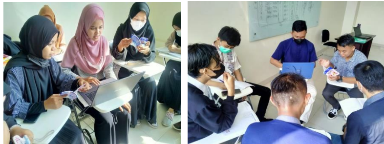
Gambar 1 Pendampingan Praktek SPSS Statistik deskriptif

diharapkan ahli dalam menguasai SPSS sehingga dapat bekerja secara mandiri, Kegiatan pelatihan yang dilaksanakan selama tiga hari dapat dilihat pada gambar 1. Pada hari pertama kegiatan pengabdian membekali mahasiswa praktek analisis data di SPSS