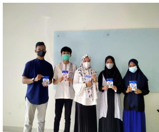
Gambar 3. Kegiatan Akhir

Kegiatan ini berlangsung dengan baik dimana tim pengabdian dapat mengamati bahwa mahasiswa mampu mengolah data-data hasil penelitiannya. Hasil ini dapat dilihat karena mahasiswa seolah-olah menganalisis data tugas akhir (skripsi). Secara keseluruhan, para peserta senang dengan adanya pelatihan SPSS ini dapat dilihat pada gambar 3.